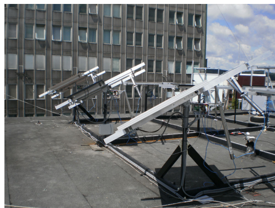
Obr. 4. Fotovoltické panely v externej časti laboratória (pohľad na FV panely umiestnené na trackeroch; popis je uvedený v prvom stĺpci tabuľky I.)

Uvedené fotovoltické panely sú umiestnené na streche budovy, ktorá usporiadaním okolitých budov vytvára vhodné podmienky pre meranie (FV panely nie sú ovplyvnené zatičením od okolitých budov a je možné realizovať celodenné, resp. nepretržité merania počas celého roka).