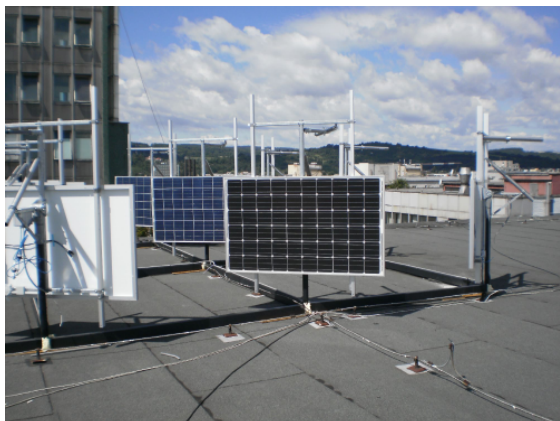
Obr. 2. Fotovoltické panely v externej časti laboratória