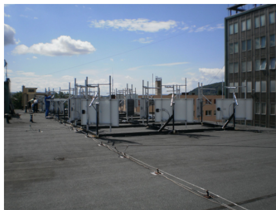
Obr. 1. Pohľad na fotovoltické panely v externej časti laboratória