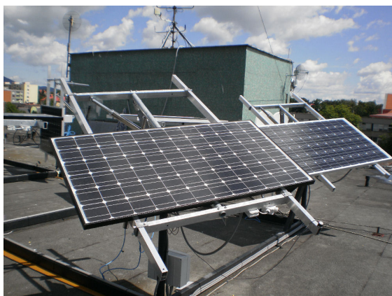
Obr. 3. Pohľad na monokryštalický FV panel osadený v externej časti laboratória